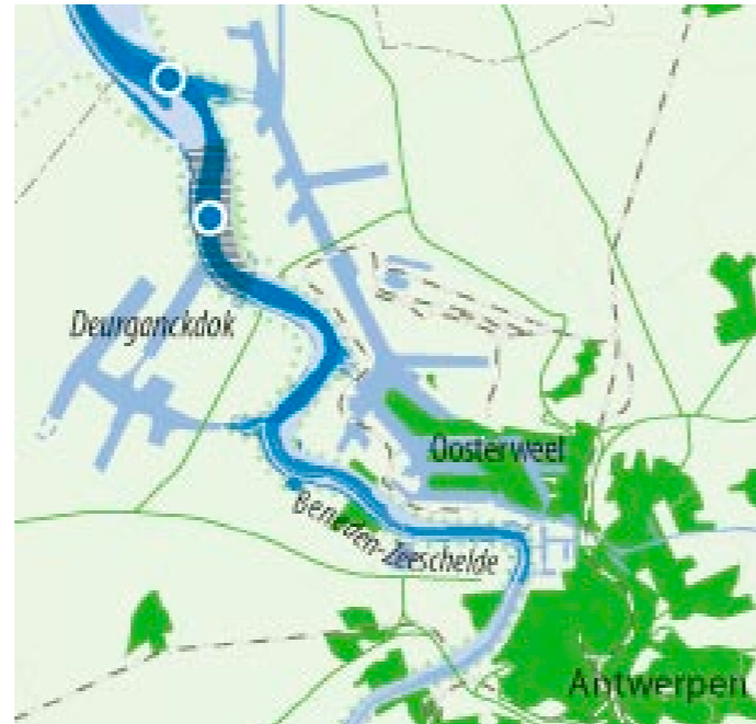
vorgeschlagenen Maßnahmen für die Zugänglichkeit

Für das Idealbild des Schelde-Ästuariums ist es wichtig, dass die Dynamik des Ästuariums und des Mehrrippensystems erhalten bleibt. Eine andere Instandhaltungsweise der Fahrrinnen kann dazu beitragen. Um die Schwellen auf der gewünschten Tiefe zu halten, müssen die Fahrrinnen ständig ausgebaggert werden. Mit einer sorgfältigen Auswahl der Schüttstellen kann eine Versandung der Nebenrinnen und ein Abbruch von