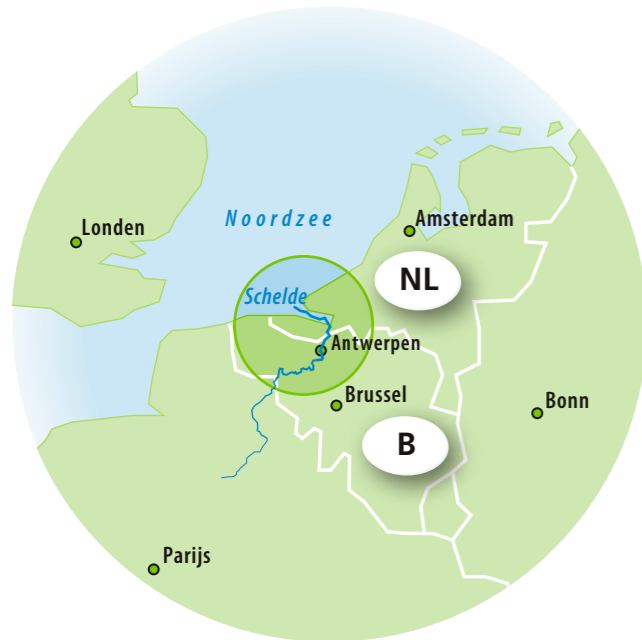
Karte von Nordwesteuropa, in der das Schelde-Ästuarium umrahmt wurde.

Um dieses Idealbild zu erreichen, ist eine kohärente Vorgehensweise im Gebiet von Gent bis zur Mündung in die Nordsee erforderlich. Von alters her war das Schelde-Ästuarium die Lebensader für Flandern und Seeland. Die Region hat sich rund um das Ästuarium entwickelt. Die Gezeiten, die Wirtschaft und die Natur kümmern sich wenig um die Landesgrenze. Nur durch eine Betrachtung der Region als Ganzes können alle Interessen, die eine Rolle spielen, gut gegeneinander abgewogen werden.