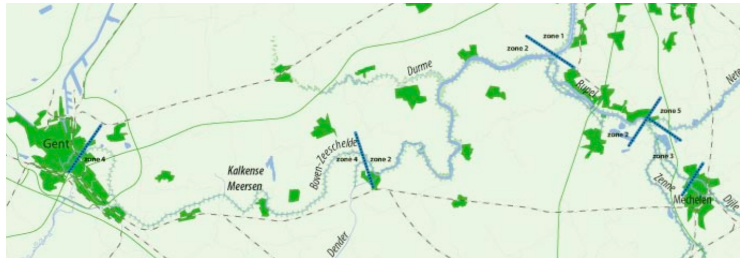
Karte mit vorgeschlagenen Sicherheitsmaßnahmen

In der Vergangenheit wurde unter anderem bei der Vorbereitung des Sigmaplans erwogen, eine Sturmflutwehr in der Zeeschelde zu bauen. Während der Besprechung des Entwurfs der Entwicklungsskizze wurde erneut für eine Sturmflutwehr in der Zeeschelde bei Oosterweel plädiert.