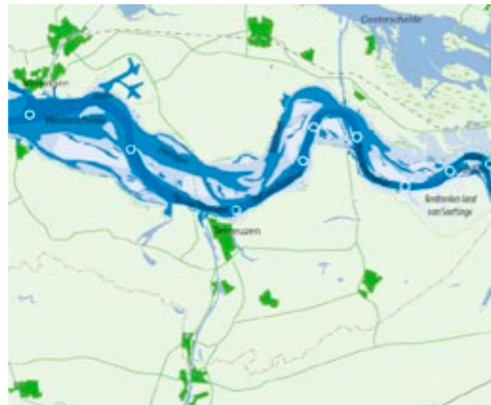
vorgeschlagenen Maßnahmen für die Zugänglichkeit