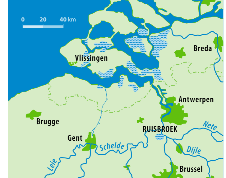
Karte der überschwemmten Gebiete 1953 und Überschwemmung in Ruisbroek

Die Länder haben beschlossen, die Sicherheit entlang der Zeescheide durch die Anlage kontrollierter Überschwemmungsgebiete vor 2030 zu erhöhen. Wo es keinen Platz für Überschwemmungsgebiete gibt, wie in Städten und