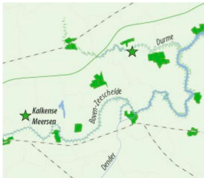
vorgeschlagenen Maßnahmen für die Natürlichkeit

Die „Vlakte van de Raan“ ist eine untiefe Sandbank in der Mündung der Westerschelde. Die Platte liegt teilweise auf belgischem und teilweise auf niederländischem Hoheitsgebiet. Die „Vlakte van de Raan“ ist ein wichtiges Laichgebiet für Fische und beherbergt ein reiches Bodenleben. Dadurch ist die Ebene ein wichtiger Nahrungsfundort für die große Seeschwalbe, eine geschützte Vogelart. Die Niederlande und Belgien werden das Gebiet anmelden, um im Rahmen der Vogel- und Habitatrichtlinie als geschütztes Gebiet ausgewiesen zu werden. Die Naturwerte des „Seenaturschutzgebiets“ erhalten dadurch einen gesetzlichen Schutz.